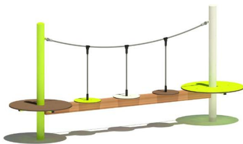
Tellersteig 21000 EM-L12-21000-G1-S5-L1