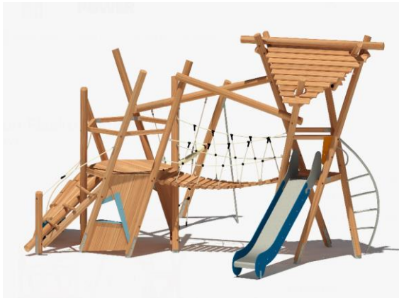
Spielkombination Fiasko Gongolo 2650 EM-S7-2650-G1-S6-F3-AR1V1